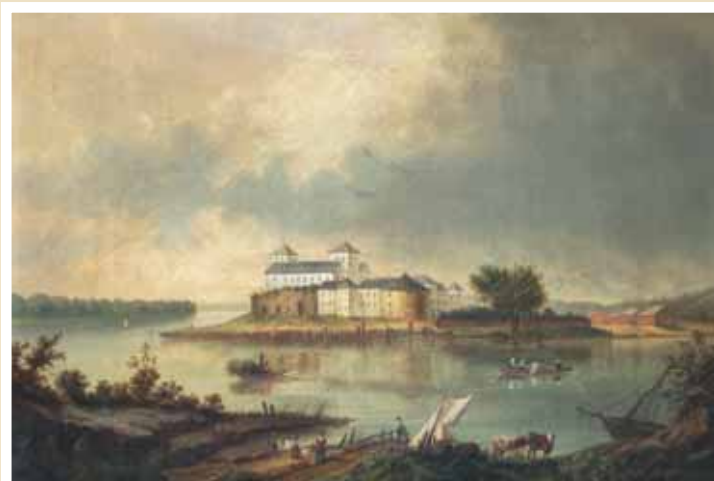
Thomas Leglerin maalaus 1800-luvun puolivälistä: Turun linna 1600-luvulla. Turun museokeskus

Jokisataman muodostivat porvareiden tavara-aitat. Niiden laitureihin kiinnittyneet hansojen koggi-laivat hallitsivat kaupunkikuvaa torin, tuomiokirkon ja porvaristalojen kanssa. Vilkkaiden ulkomaanyhteyksien ansiosta Turusta kehittyi luonnostaan Suomen pääkaupunki.