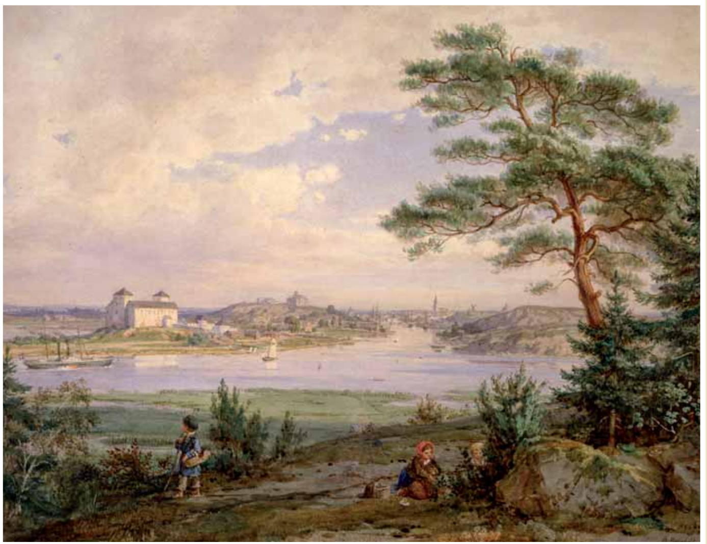
Bernhard Reinholdin maalaus 1872. Åurajoen suun maisemia, jossa ei nykyaiksesta satamasta vielä näy merkkejä. 1830 luvulla ensimmäiset todelliset turistit saapuivat Turkuun. Turun museokeskus