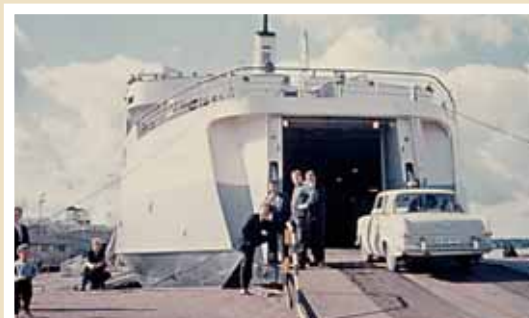
Matkustajia nousemassa autolautta Nordiaan 1970-luvun alussa.