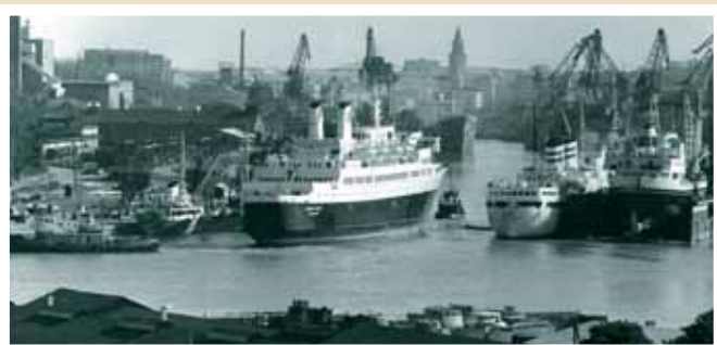
Telakkanäkymä Aurajoesta 1960-luvulla.