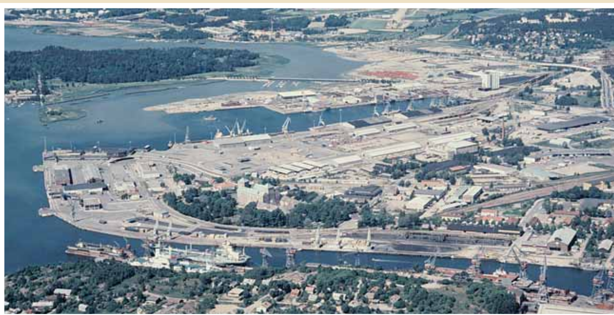
Turun satama 1970-luvun alussa.