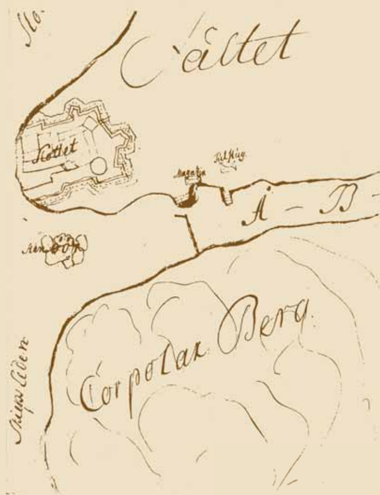
Osa 1700-luvun alkupuolella laaditusta kaavamaisesta kartasta, jossa linnan kaupungin puolelle on piirretty sekä avattava tullipuomi, satamavarasto että tullitupa.