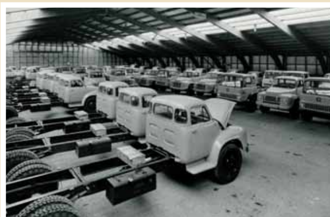
Autojen tuontia Turun satamassa vuodelta 1936.