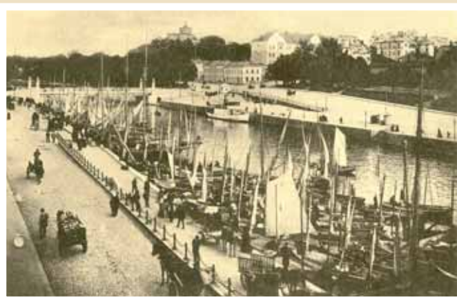
1900-luvun alun silakkamarkkinoilta, Aurasillan alapuolelta. Syysmarkkinat järjestettiin säännöllisesti ainakin vuodesta 1636 alkaen.