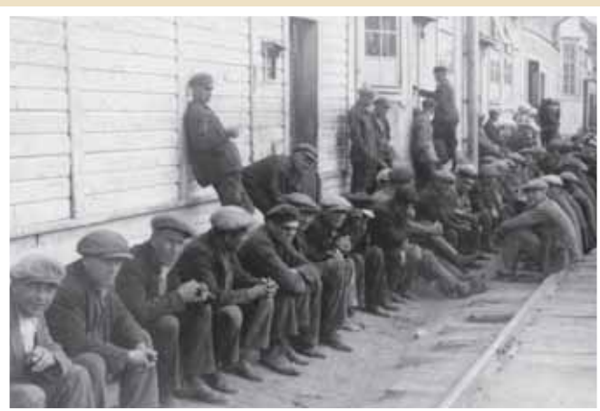
Työnjakotilaisuutta odotettiin kauniina elokuun päivänä 1936.