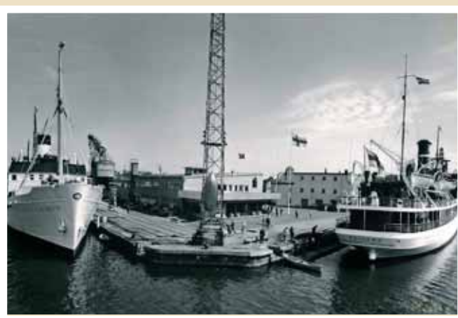
Oikantin kärki 1950-luvun jälkipuoliskolla. Vasemmalla Svea Regina ja oikealla SHO:n Wellamo.